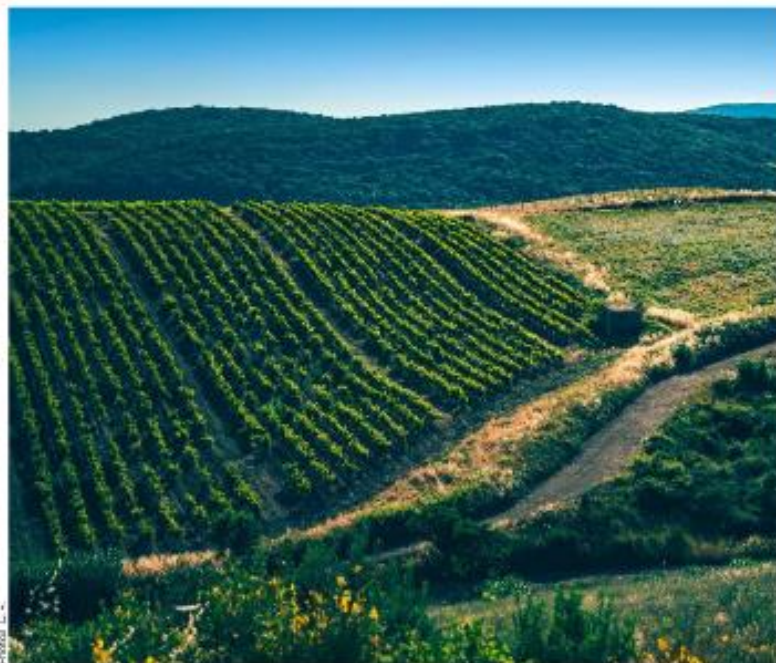
Garrigue, bois, murets et capitelles marquent le paysage viticole de Faugères.

tiel monte alors que la maturation phénologique ne progresse pas).