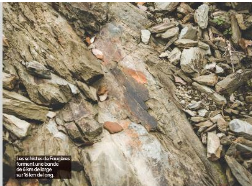
Les schistes de Faugères forment une bande de 6 km de large sur 16 km de long.